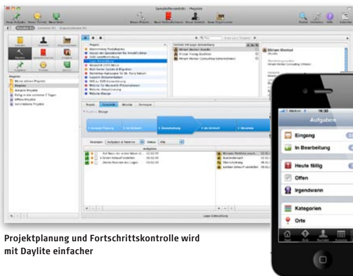
Projektplanung und Fortschrittskontrolle wird mit Daylite einfacher

Kundenbeziehungsmanagement oder Customer Relationship Management (CRM) ist der Schlüssel für erfolgreiche Geschäfte, so steht es in jedem Business-Ratgeber. Doch auch wer größere Projekte plant und Gruppenaktivitäten organisiert, benötigt eine Software, die diese über Mail, iCal und Adressbuch hinaus verbindet. Daylite integriert die Apple-Programme und bietet viele Erweiterungen für die komfortable Organisation – jetzt endlich auch auf Deutsch.